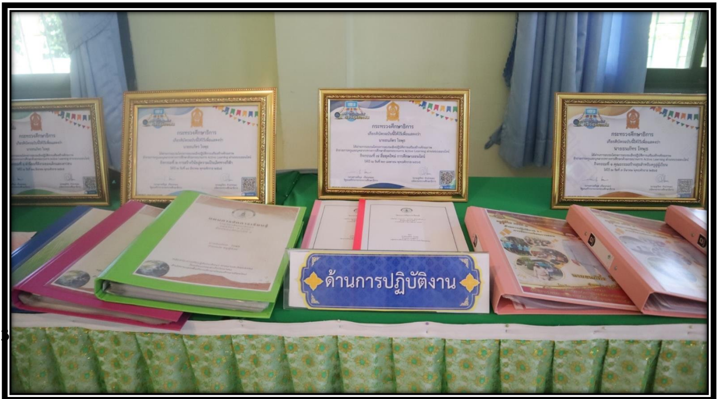
ทั้งนี้ ได้แนบไฟล์ แบบประเมินการพัฒนาครุผู้ช่วยอย่างเข้ม