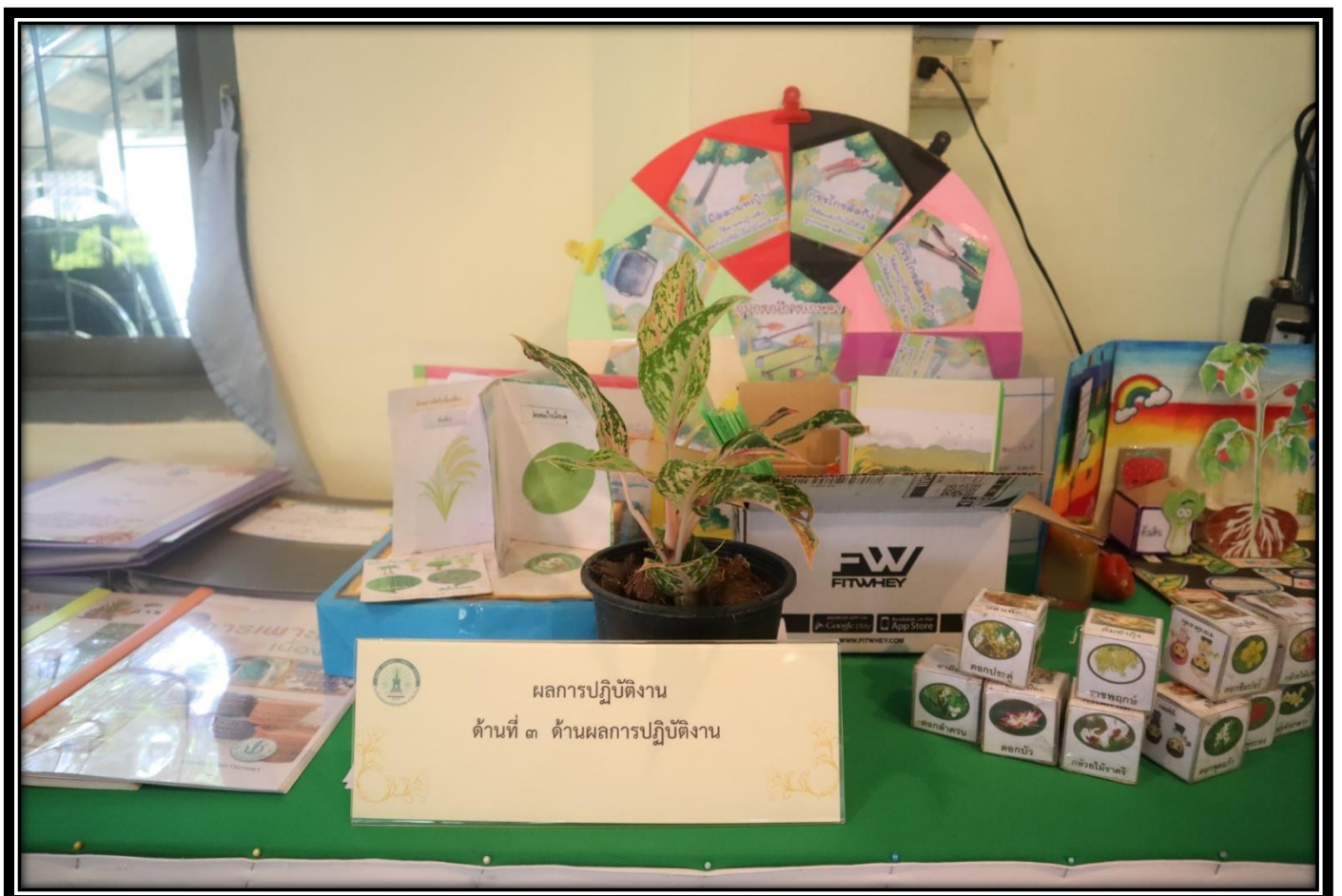
ผลการปฏิบัติงาน ด้านที่ ๓ ด้านผลการปฏิบัติงาน