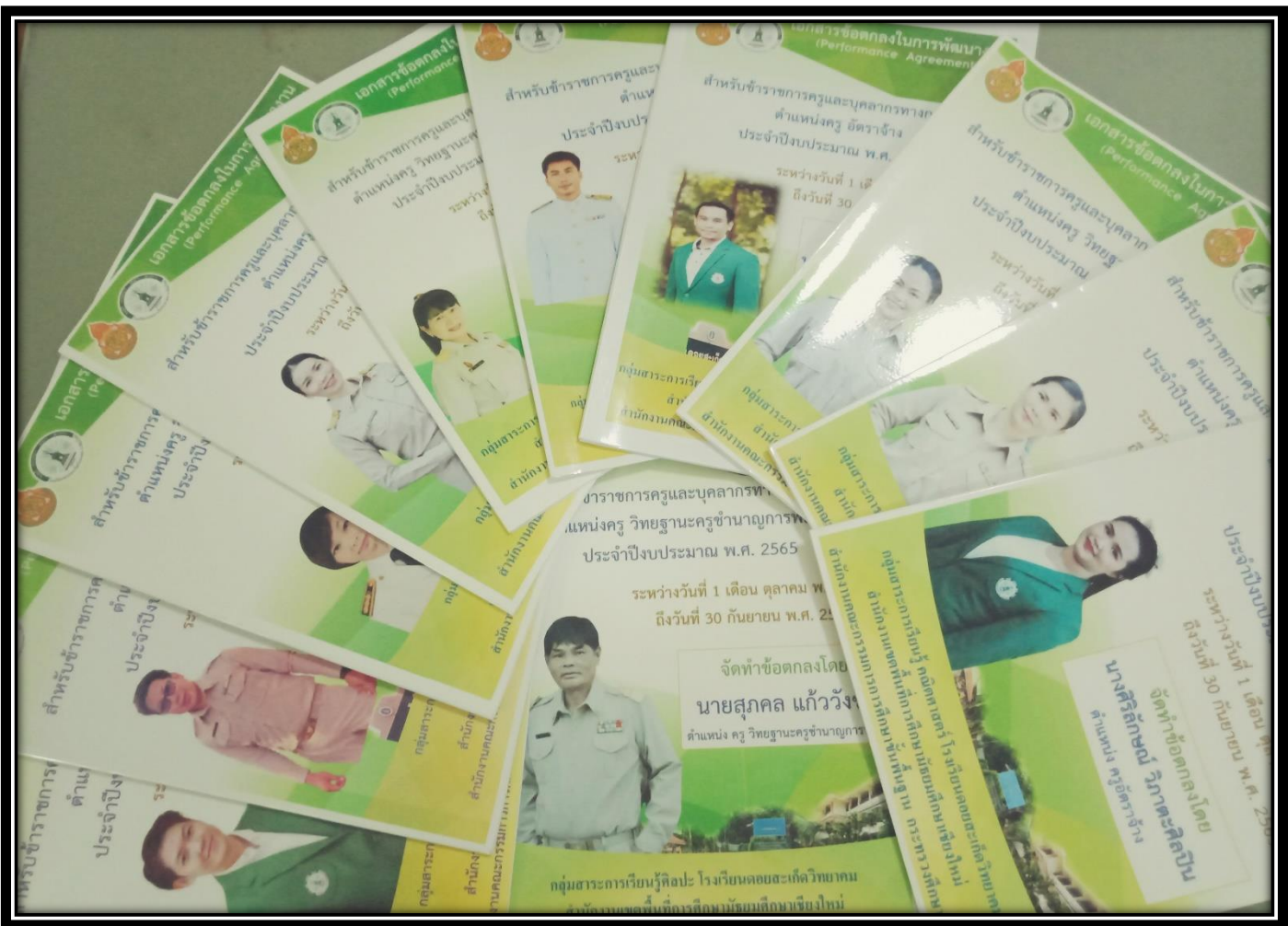
ทั้งนี้ ได้แนบไฟล์ แบบบันทึกการลงนามข้อตกลงในการพัฒนางาน ( PA )